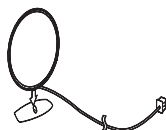
Antena AM (1)