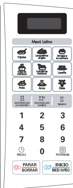
MS#FI í œ