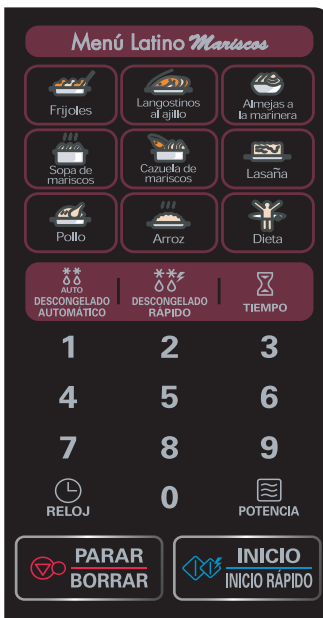
MS1147X / MS1147G / MS1147GW MS 1147GS / MS1149X

Este horno de microondas está diseñado para uso doméstico solamente. No es recomendable para propósitos comerciales.