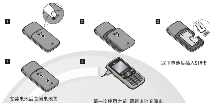
安装电池后关闭电池盖 第一次使用之前,请将电池充满电。